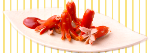
タコさんウインナー ¥400