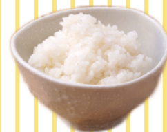
ごはん 小100g ¥100 中150g ¥150 大300g ¥300